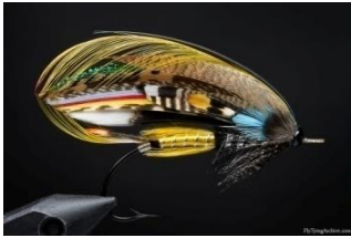
Moderne Jock Scott og den originale .

Bildet med den originale fluen, samt rettighetene til fluen, eies fremdeles av firma "Forrest of Kelso" men de sier: "Forrest of Kelso eier på en måte fluen men kunne aldri drømme om hevde rettighetene. Det er tross alt verdens mest berømte flue og alle kan binde den."